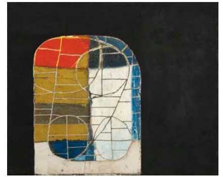
MECANICA (ÉTUDE) 61cm x 50cm - 2007 Plâtre, huile et acrylique sur bois