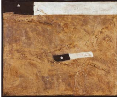
MADRE E HIJA (La nueva generación) 75cm x 62cm – 2001 Acrylique, huile, encre et papier sur toile