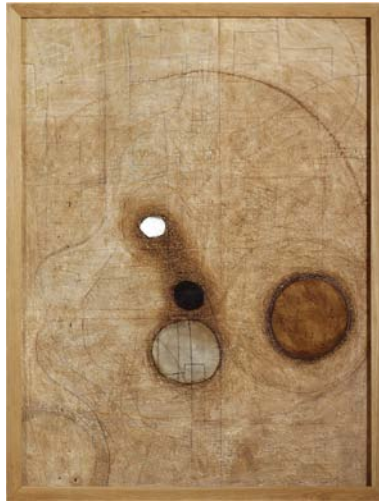
LA PEAU DE LA MÉMOIRE (La piel de la memoria) 120cm x 160cm – 2004 Acrylique, plâtre et encre sur bois