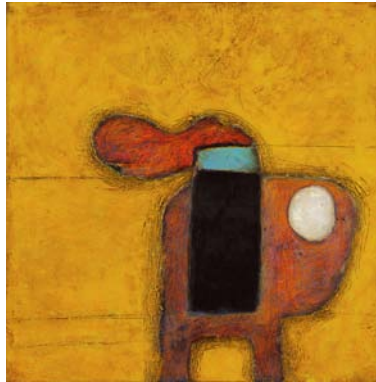
EL PERLA (el artista) 80cm x 80cm – 2004 Acrylique, huile, papier, encre et pastel sur toile