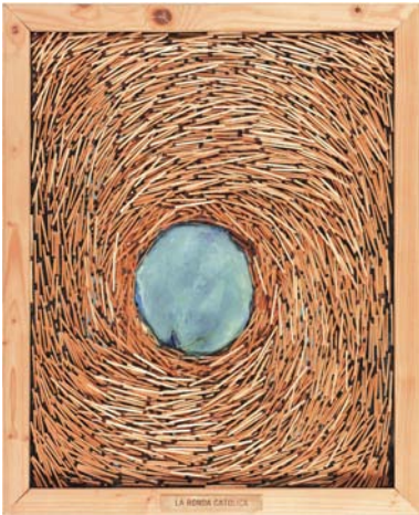
LA RONDA CATHOLICA (La Ronde catholique) 44cm x 54cm - 2002 Allumettes et acrylique sur toile