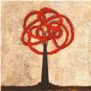
EL VOLCAN DISCRETO 80cm x 80 cm – 2003 Papier, encre, acrylique, scie sur toile