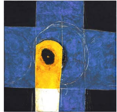
EL SECRETO DE BATMAN 80cm x 80cm - 2004 Acrylique, plâtre, encre et pastel sur bois