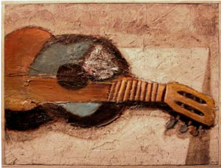
LA GUITARRA HERIDA - 61cm x 50cm - 2001 Plâtre, acrylique, papier et encre sur toile