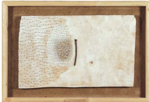
LA PROYECCION DEL EGO - 78cm x 54cm - 2002 Clous, papier et encre sur carton