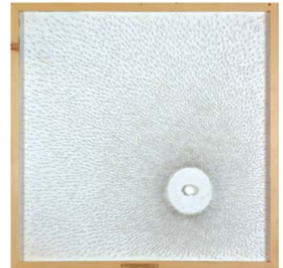
LA CURIOSIDAD CIENTIFICA (La Curiosité Scientifique) 95cm x 95cm - 2002 Épingles, papier et acrylique sur bois